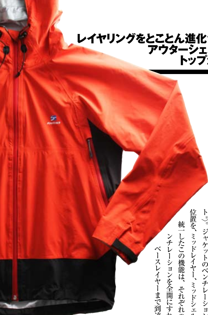
エバーブレス® パリオ ジャケット

ファイントラックのこだわりはそれだけではない。特筆しておきたいのは汗の処理を徹底的に考えられた(リンクベント®)。ジャケットのベンチレーションの位置を、ミッドレイヤー、ミッドシェルと統一したこの機能は、それぞれのベンチレーションを全開にすればベースレイヤーまで到達す