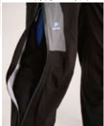
エバーブレス® パリオ パンツ

MEN'S ¥23,100 (税込) / サイズ: S~XL / カラー: ブラック / 重量: 400g WOMEN'S ¥22,050 (税込) / サイズ: S~L / カラー: グラファイト / 重量: 350g