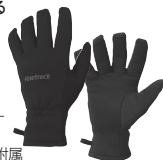
撥水ミッドレイヤー フラッドラッシュ® サーモグローブが付属

オールランドに使えるベーシックモデル。ファンアクションで締め付けも開放も可能なスノースカート、バームには耐久加工を施したハイグレードレザーを使用するなど、機能性に配慮したデザインが施されている