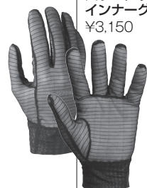
フラッドラッシュ® パワーメッシュ インナーグローブ ¥3,150