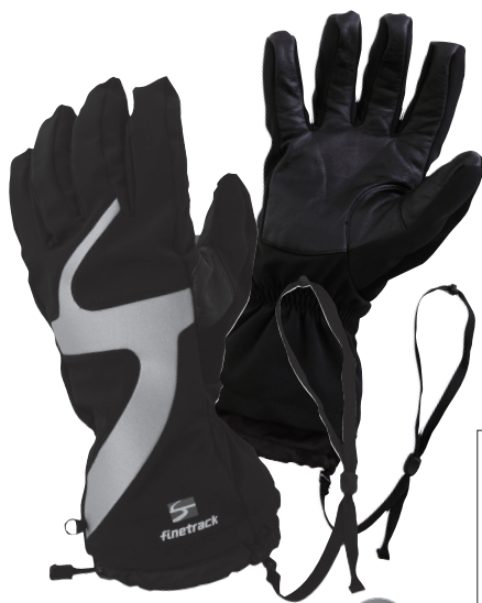
エバーブレス®スノーグローブ ¥14,280

オールランドに使えるベーシックモデル。ファンアクションで締め付けも開放も可能なスノースカート、バームには耐久加工を施したハイグレードレザーを使用するなど、機能性に配慮したデザインが施されている