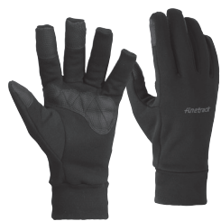
フラッドラッシュ® EXPグローブ ¥5,040

エバーブレス®シリーズにはテクニカルな登山に対応するアイズグローブもラインナップ。また、単体でも、ミッドレイヤーグローブとしても使えるミッドレイヤーが2タイプ。フラッドラッシュ®EXPグローブと、メリノスピン™サーモグローブ。こちらはシンサレート™ストレッチを使用したものとそれぞれ特徴がある。ドライレイヤーとして着用するのはフラッドラッシュ®パワーメッシュインナーグローブ。超軽量でストレッチ性に優れ、手肌を快適に保つ。