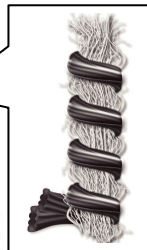
未防縮ウール&ポリエステルの 特殊ハイブリッド糸