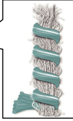
天然ラミー&ポリエステルの特 殊ハイブリッド糸