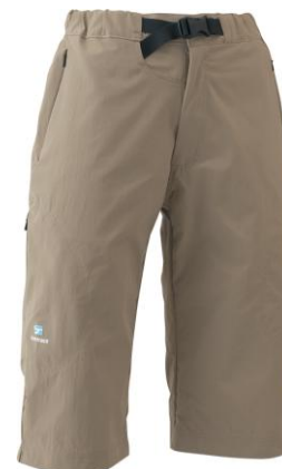
WOMEN'S ハーフパンツ カラー：オーカー(OC)