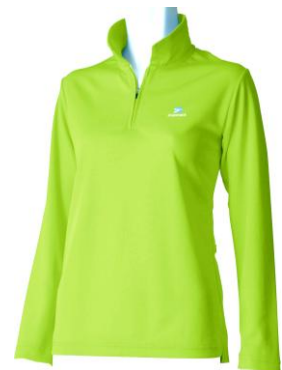
ドラウトベント™WOMEN'S ジップロングポロ 新色スプラウトグリーン(SG)

株式会社 finetrack は、KCOI(神戸商工会議所)創業塾5期卒業生と国内大手総合アウトドアメーカーで勤務していたメンバーを中心に、長年アウトドアを実践してきた有志が集まり、国内ベンチャーとして2004年1月に創業いたしました。「安全」をキーワードに「創り手=遊び手」の強みを生かし素材開発から物創りをすすめております。