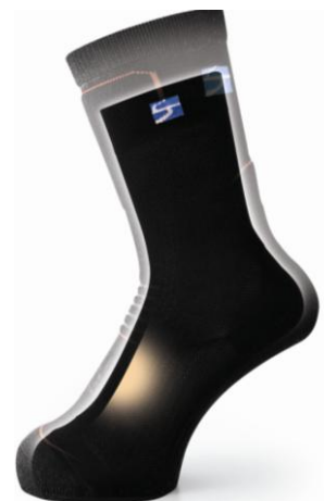
重ね履きのイメージ図 内側がフラッドラッシュ®スキンメッシュ ソックス 外側がスパイルフィル™ソックス