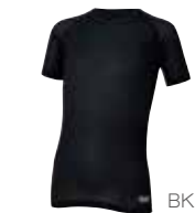
2 スキンメッシュ® T