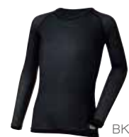
1 スキンメッシュ® ロングスリーブ