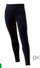
2 フラッドラッシュ® タイツ