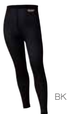
3 スキンメッシュ® タイツ