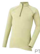
1 フラッドラッシュ® ジップネック