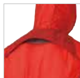
背面上部の大型ベンチレーション