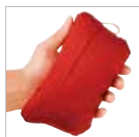
胸ポケットに収納可能なポケットフル仕様