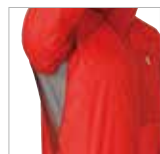
脇のメッシュパネル