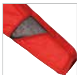
外気をとり込んだり熱を逃がす袖口メッシュパネル